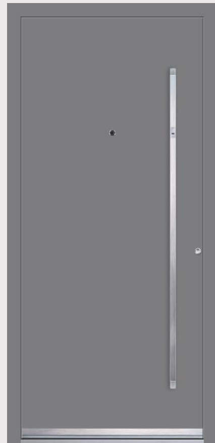
MODELL 3 Farbe RAL 9007; Griff KCRF 160h; Rosette RMM; Fingerscanner AFS; Designsockel JZC 51; Spy SPY1