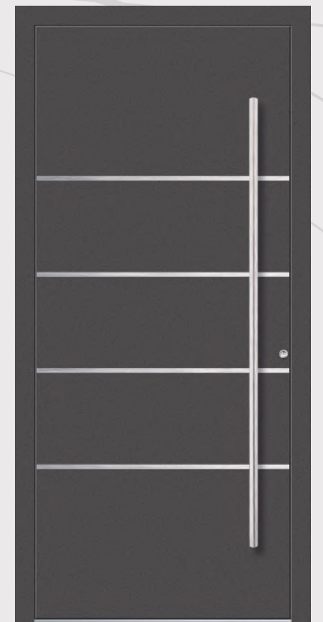
MODELL 11 Farbe 29/80077; Griff OCR 160h; Rosette RMM