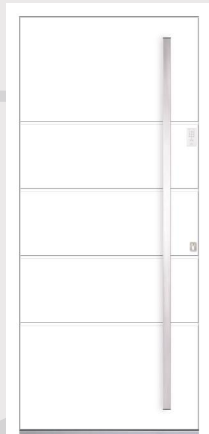
MODELL 4 Farbe RAL 9016; Griff KCK 190h; Rosette RKP 50; Tastaturen WKB