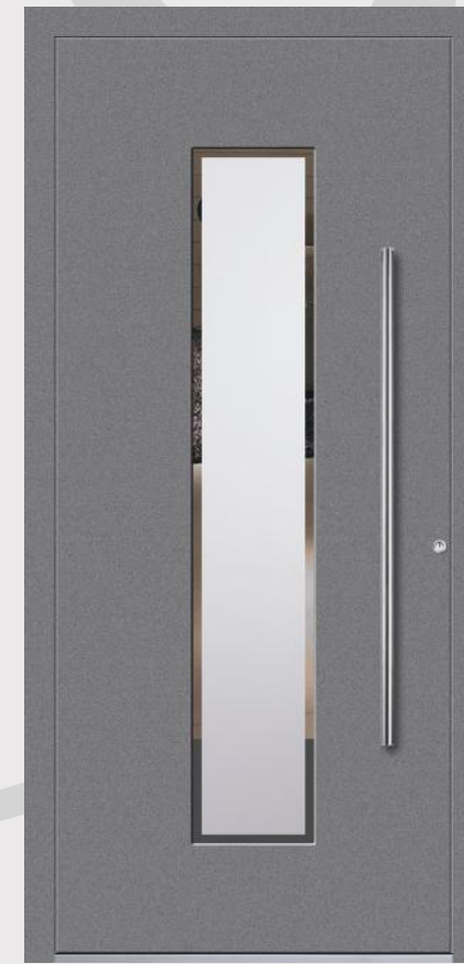
MODELL 8 Farbe GRIGIO ANTICO; Verglasung FPK; Griff OPR 115h; Rosette RMM