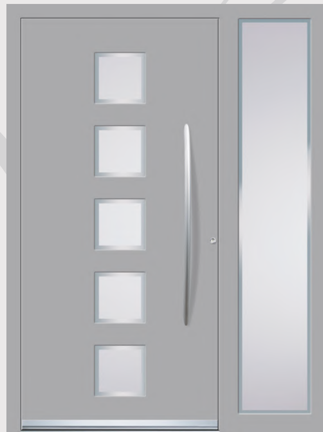
MODELL 6 Farbe RAL 9006; Verglasung DPJ; Griff OPT 100; Rosette RMM; Designsockel JZP 50; Seitenteil rechts DPJ