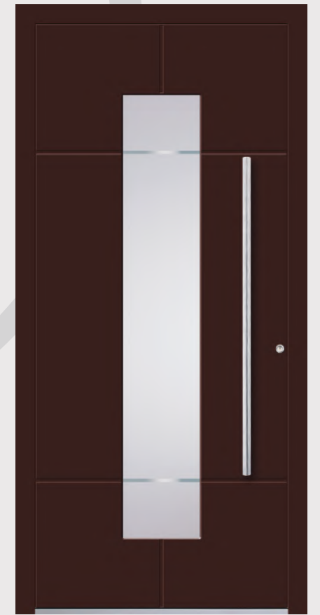
MODELL 9 Farbe RAL 8017; Verglasung DPL; Griff OCR 115h; Rosette RMM