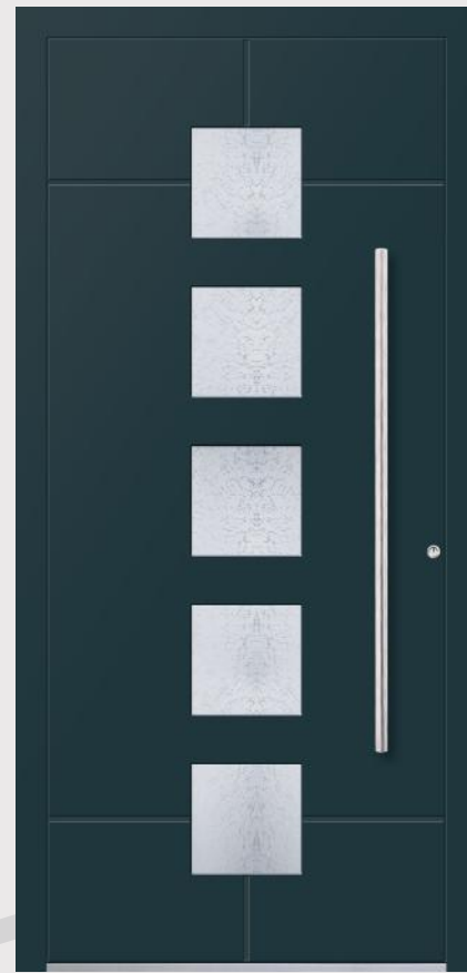
MODELL 7 Farbe RAL 7016; Verglasung MADRAS UADI; Griff OCR 115h; Rosette RMM