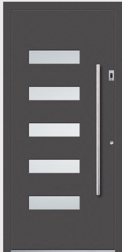
MODELL 2 Farbe 29/80077; Verglasung SATINATO; Griff OCR 115h; Rosette RMM; Fingerscanner IFS